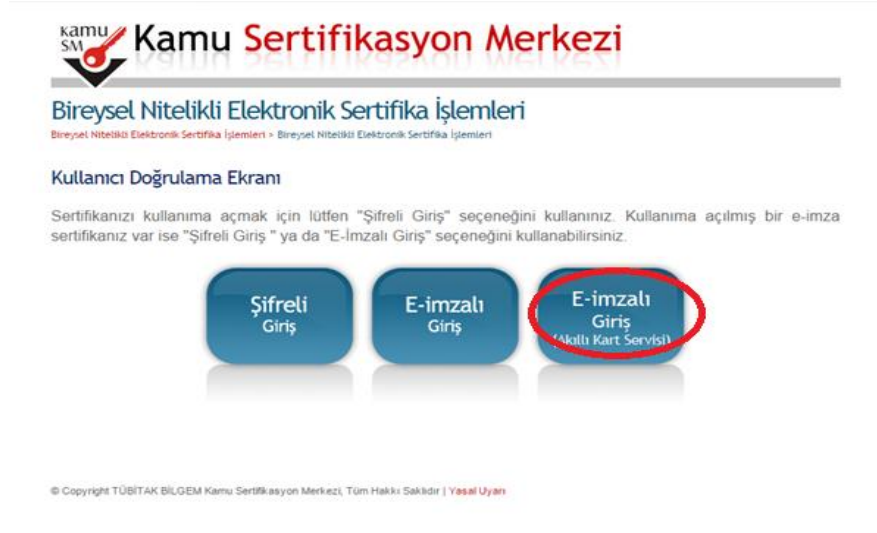
Şekil 1: Online İşlemler Menü

www.kamusm.gov.tr Kamu SM anasayfasında yer alan "Online İşlemler" linkine tıklanıp açılan menüden "Nitelikli Elektronik Sertifika İşlemleri" linkinden giriş yapılmalıdır. Kullanıcı doğrulama ekranından E-imzalı Giriş veya (Akıllı Kart Servisi) linkine tıklanmalıdır.