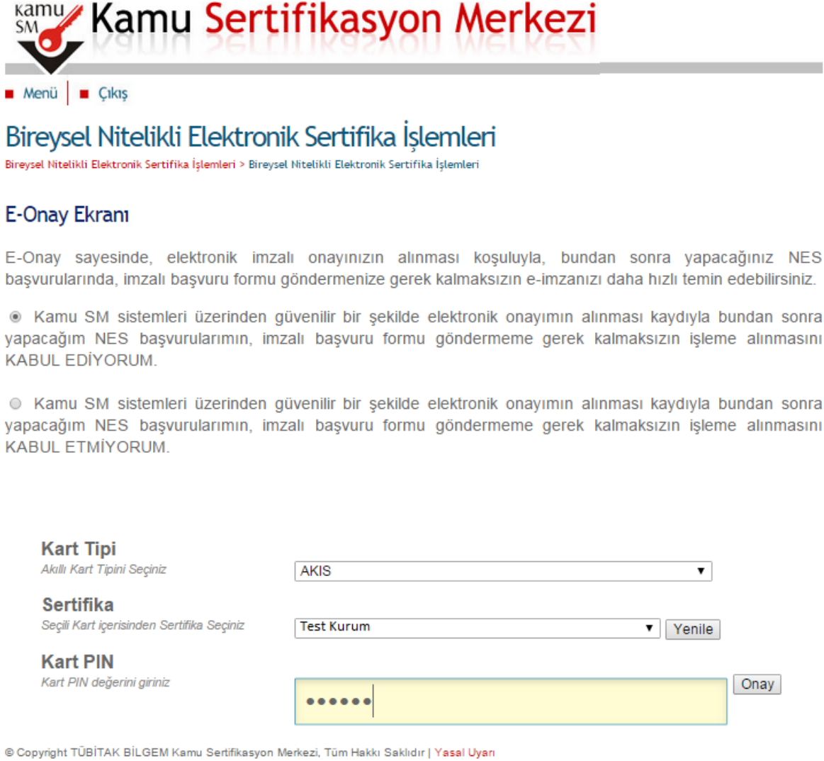
Şekil 4: E-Onay Ekranı

Ekranında ilgili metinde "KABUL EDİYORUM" olarak seçilir ve PINKodu girilerek e-imza ile onaylanır.