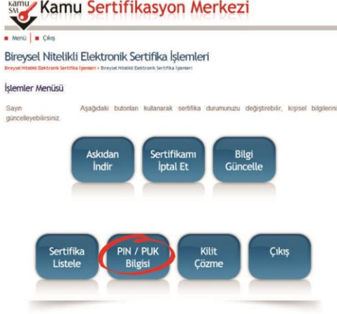
Şekil 7 Sertifika İşlemler Menüsü