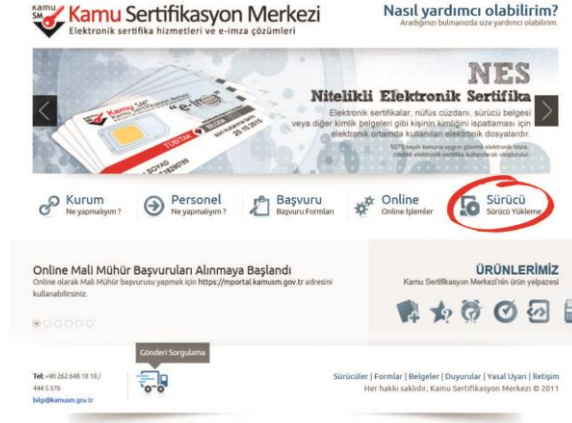
Şekil 3 Sürücü Yükleme Ekranı