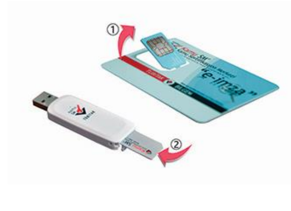
Şekil 2 Akıllı Kart ve ACS Kart Okuyucu