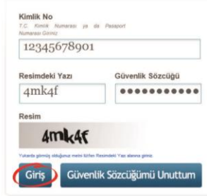
Şekil 6 Şifreli Giriş Ekranı