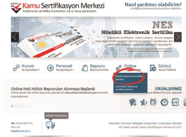
Şekil 4 Online Sertifika İşlemleri Menüsü