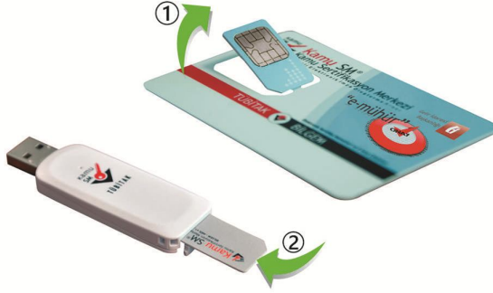
Őekil 1 Akıllı Kart ve Kart Okuyucu

Kurye tarafından teslim edilen AKİS Akıllı Kartta yer alan Mali Mühür Sertifikasının yüklü olduėu ipli para aőaėıdaki gibi hasar verilmenden iőaretili yerlerinden kırılarak ıkarılır. Eėer kenarlarında apak kaldıysa uygun bir alet ile zarar vermeden temizlenir. ıkarılan ipli para ACS 38T USB-Beyaz tipi akıllı kart okuyucuya aőaėıda görüldüėü Őekilde ve ok yönünde itilip yerleőtirilir.