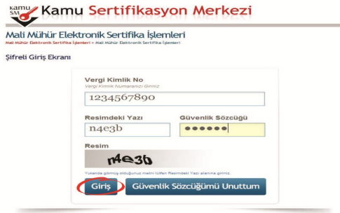
Şekil 5 Şifreli Giriş Ekranı

Vergi Kimlik No, Resimdeki Yazı ve Güvenlik Sözcüğü alanları doldurulup “Giriş” butonuna basılır. Cep telefonuna gönderilen SMS Onay Kodu girilir.