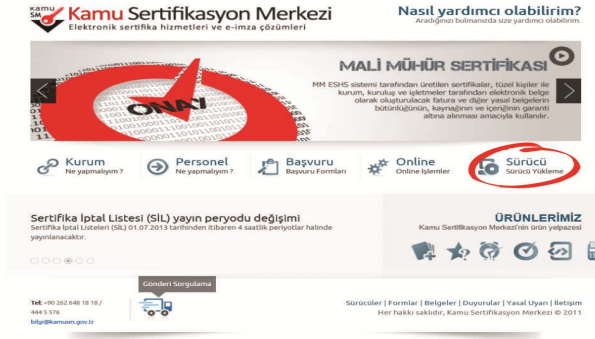
Şekil 2 Sürücü Yükleme Ekranı

http://www.kamusm.gov.tr adresinde “Sürücü” menüsünden işletim sistemine uyumlu sürücüler indirilir ve kurulur.