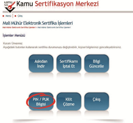
Şekil 6 Sertifika İşlemler Menüsü

Mali Mühür Elektronik Sertifikası ile yapılacak işlemler için gerekli olan PIN bilgisi, "PIN / PUK Bilgisi" butonuna tıklanarak listelenebilir.