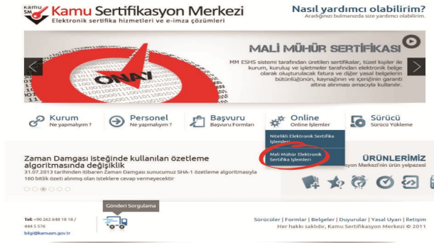
Şekil 3 Online Sertifika İşlemleri Menüsü

http://www.kamusm.gov.tr adresinde “Online İşlemler” altından “Mali Mühür Elektronik Sertifika İşlemleri” linkine tıklanır.